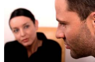
In Kooperation mit der Evangelischen Erwachsenenbildung Osnabrück und dem ORCA-Institut