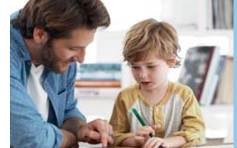
In Kooperation mit SOPRA