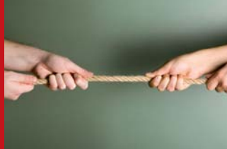
In Kooperation mit SOPRA