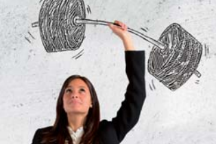
In Kooperation mit der HVHS Springe