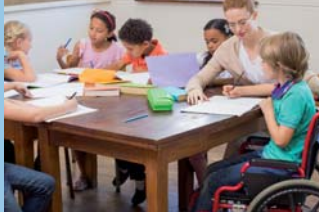
In Kooperation mit der Ada-und-Theodor-Lessing- Volkshochschule Hannover