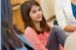
In Kooperation mit dem Traumapädagogischen Institut Norddeutschland