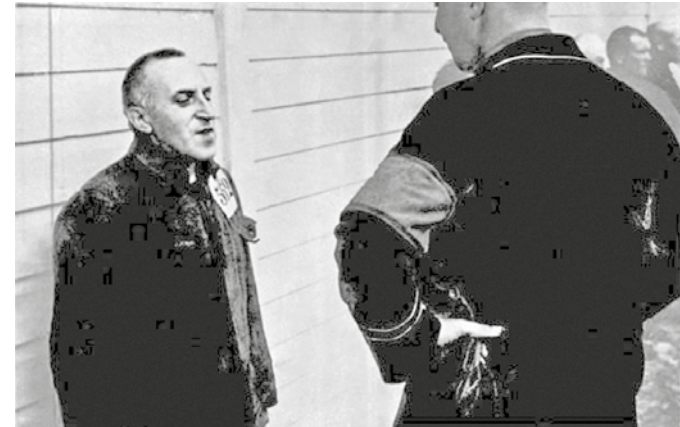
Foto: Carl von Ossietzky im Konzentrationslager Esterwegen (1934)