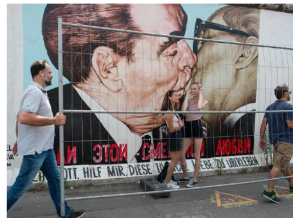
Berlin, Eastside Gallery