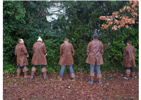
Dammer Karneval / Foto: Prof. Rolf Nobel

Vermittelt werden soll die visuelle Bedeutung der Straßenfotografie für unser Bild von historischkulturellen Abschnitten gesellschaftlicher Verhältnisse. Erlern werden sollen in dem Workshop die rechtlichen, formalen und inhaltlichen Grundlagen der Straßenfotografie, sowie die verschiedenen Methoden des Vorgehens beim Fotografieren. Diskutiert werden soll dabei auch die Abwägung zwischen den rechtlichen Rahmenbedingungen und dem historischen Bedürfnis nach der fotografischen Dokumentation gesellschaftlicher Entwicklungsphasen.